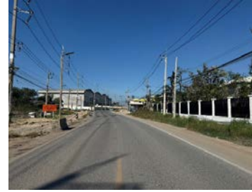
รูปเดือนธันวาคม ๒๕๖๘