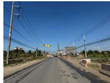
รูปเดือนธันวาคม ๒๕๖๘