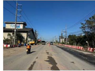
รูปเดือนธันวาคม ๒๕๖๘