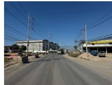
รูปเดือนธันวาคม ๒๕๖๘