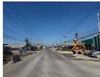
รูปเดือนธันวาคม ๒๕๖๘