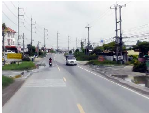
รูปก่อนการก่อสร้าง กม.ที่ ๒+๕๐๐