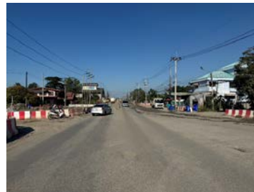
รูปเดือนธันวาคม ๒๕๖๘