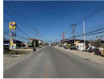
รูปเดือนธันวาคม ๒๕๖๘