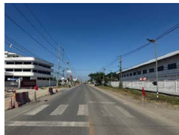
รูปเดือนธันวาคม ๒๕๖๘