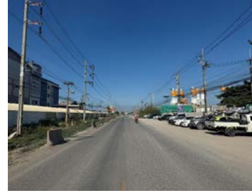
รูปเดือนธันวาคม ๒๕๖๘