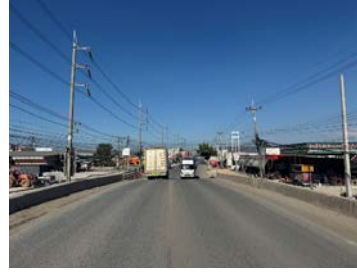
รูปเดือนธันวาคม ๒๕๖๘