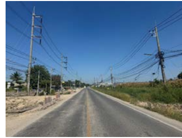
รูปเดือนธันวาคม ๒๕๖๘