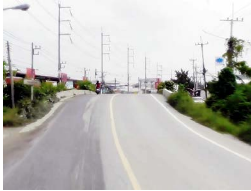
รูปก่อนการก่อสร้าง กม.ที่ ๒+๖๐๐

โครงการก่อสร้างถนนสาย ฉช.๒๐๐๔ แยก ทล.๓๔ - ทล.๓๑๔ อ.บางปะกง, เมือง จ.ฉะเชิงเทรา (ตอนที่ ๒)