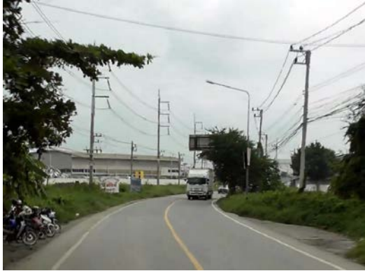
รูปก่อนการก่อสร้าง

โครงการก่อสร้างถนนสาย ฉช.๒๐๐๔ แยก ทล.๓๔ - ทล.๓๑๔ อ.บางปะกง, เมือง จ.ฉะเชิงเทรา (ตอนที่ ๒)