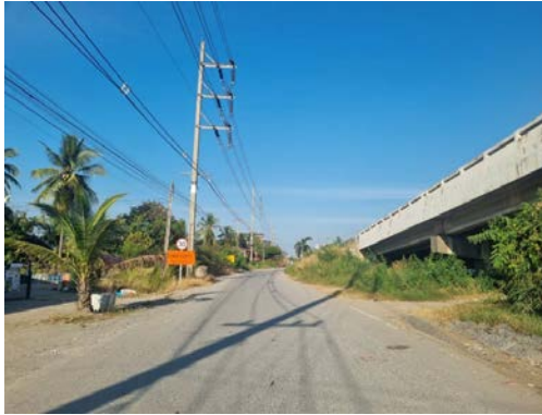
รูปก่อนการก่อสร้าง กม.ที่ ๕+๐๐๐

โครงการก่อสร้างถนนสาย ฉช.๒๐๐๔ แยก ทล.๓๔ - ทล.๓๑๔ อ.บางปะกง, เมือง จ.ฉะเชิงเทรา (ตอนที่ ๒)