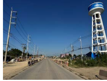
รูปเดือนธันวาคม ๒๕๖๘