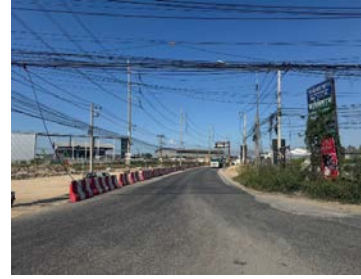
รูปเดือนธันวาคม ๒๕๖๘