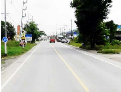
รูปก่อนการก่อสร้าง กม.ที่ ๓+๖๐๐