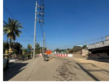
รูปเดือนธันวาคม ๒๕๖๘