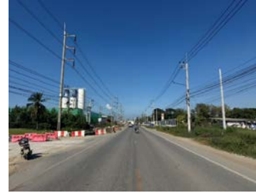
รูปเดือนธันวาคม ๒๕๖๘