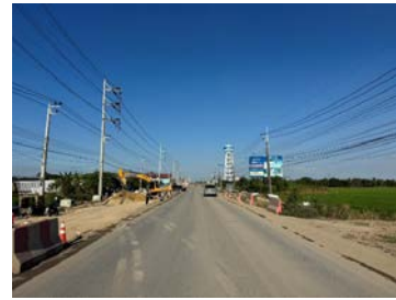
รูปเดือนธันวาคม ๒๕๖๘