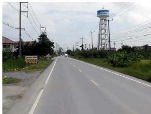
รูปก่อนการก่อสร้าง กม.ที่ ๕+๗๐๐