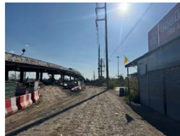
รูปเดือนธันวาคม ๒๕๖๘