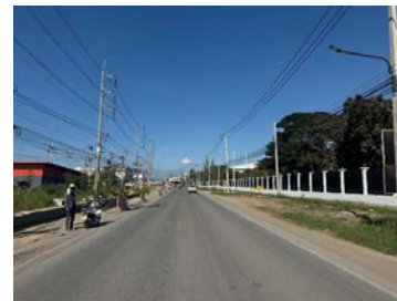
รูปเดือนธันวาคม ๒๕๖๘