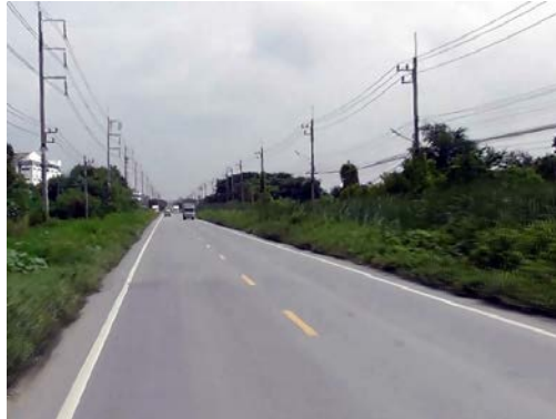
รูปก่อนการก่อสร้าง