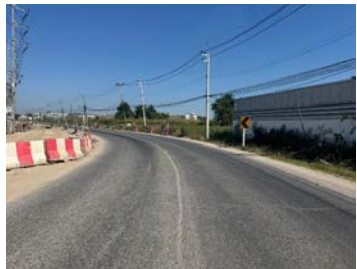
รูปเดือนธันวาคม ๒๕๖๘