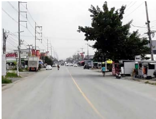
รูปก่อนการก่อสร้าง กม.ที่ ๒+๗๐๐