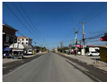
รูปเดือนธันวาคม ๒๕๖๘