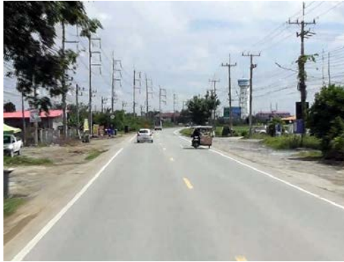
รูปก่อนการก่อสร้าง กม.ที่ ๕+๔๐๐