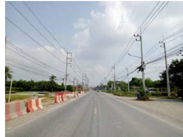
รูปเดือนกุมภาพันธ์ ๒๕๖๙