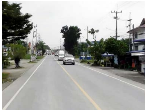
รูปก่อนการก่อสร้าง กม.ที่ ๓+๕๐๐