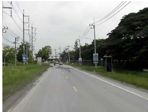
รูปก่อนการก่อสร้าง กม.ที่ ๑+๙๐๐