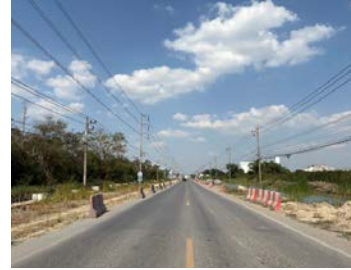
รูปเดือนมกราคม ๒๕๖๙