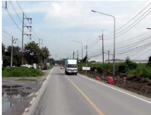
รูปก่อนการก่อสร้าง กม.ที่ ๐+๔๐๐