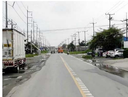
รูปก่อนการก่อสร้าง กม.ที่ ๓+๙๐๐