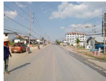
รูปเดือนมกราคม ๒๕๖๙