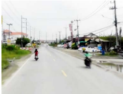
รูปก่อนการก่อสร้าง กม.ที่ ๒+๔๐๐