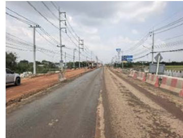
รูปเดือนกุมภาพันธ์ ๒๕๖๙