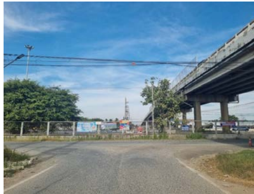
รูปก่อนการก่อสร้าง กม.ที่ ๔+๙๐๐