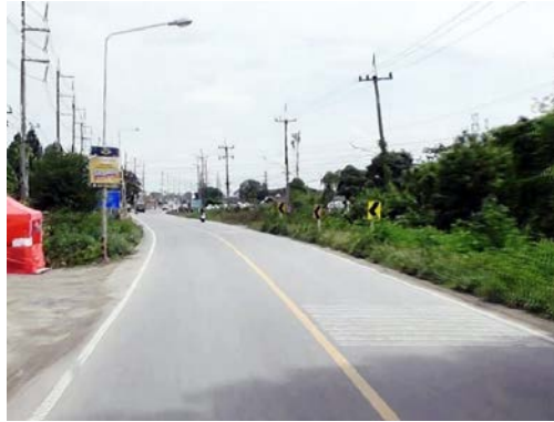
รูปก่อนการก่อสร้าง กม.ที่ ๖+๒๐๐