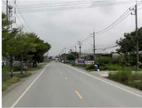
รูปก่อนการก่อสร้าง กม.ที่ ๑+๖๐๐