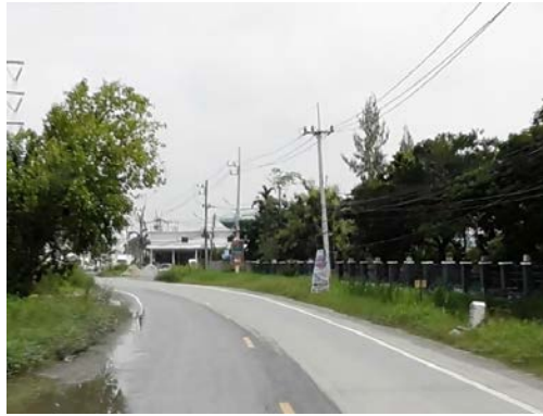
รูปก่อนการก่อสร้าง กม.ที่ ๒+๐๐๐