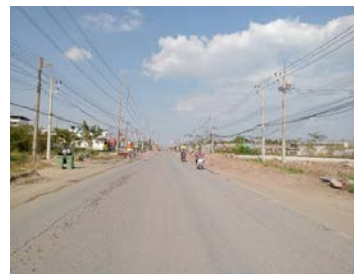
รูปเดือนมกราคม ๒๕๖๙