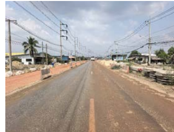
รูปเดือนกุมภาพันธ์ ๒๕๖๙