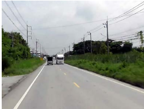
รูปก่อนการก่อสร้าง กม.ที่ ๑+๒๐๐