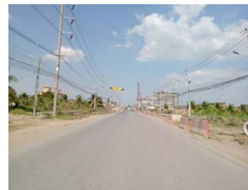
รูปเดือนมกราคม ๒๕๖๙