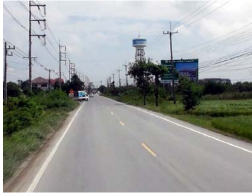
รูปก่อนการก่อสร้าง กม.ที่ ๕+๖๐๐