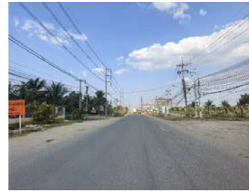
รูปเดือนมกราคม ๒๕๖๙