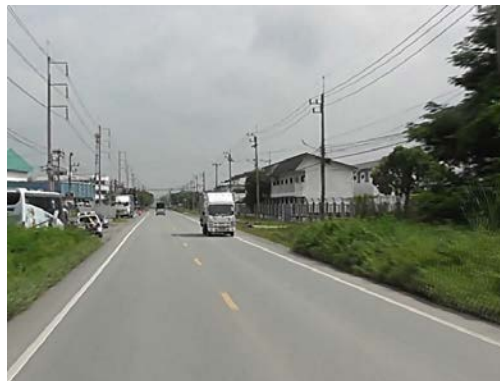
รูปก่อนการก่อสร้าง กม.ที่ ๑+๓๐๐