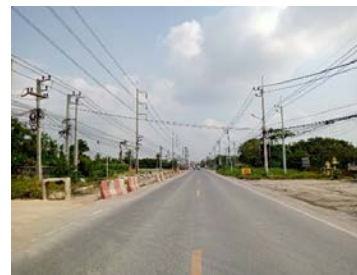
รูปเดือนกุมภาพันธ์ ๒๕๖๙