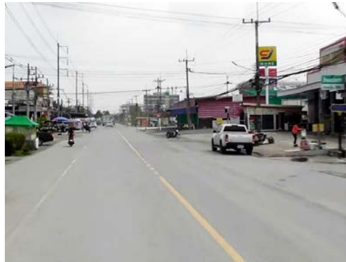
รูปก่อนการก่อสร้าง กม.ที่ ๓+๐๐๐