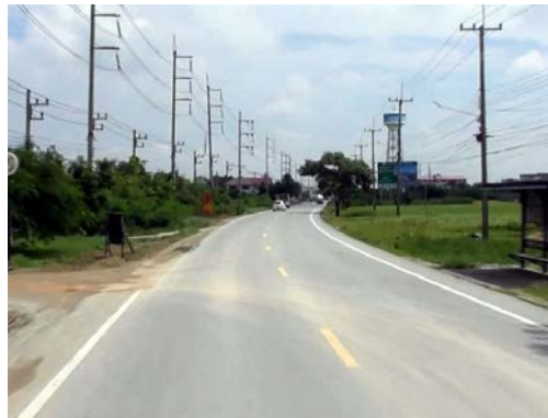
รูปก่อนการก่อสร้าง กม.ที่ ๕+๕๐๐