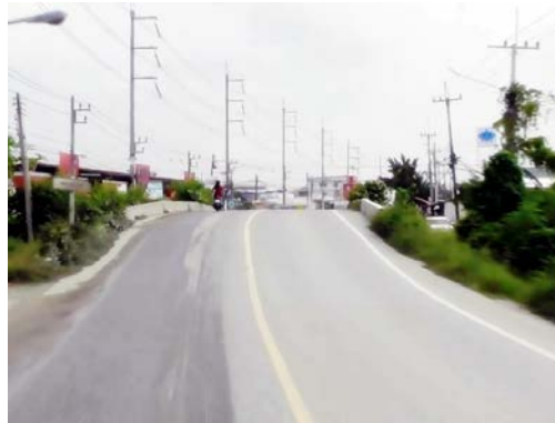
รูปก่อนการก่อสร้าง กม.ที่ ๒+๖๐๐

โครงการก่อสร้างถนนสาย ฉช.๒๐๐๔ แยก ทล.๓๔ - ทล.๓๑๔ อ.บางปะกง, เมือง จ.ฉะเชิงเทรา (ตอนที่ ๒)