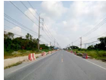
รูปเดือนกุมภาพันธ์ ๒๕๖๙