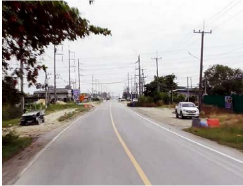
รูปก่อนการก่อสร้าง กม.ที่ ๖+๔๐๐