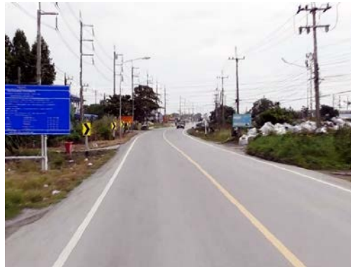
รูปก่อนการก่อสร้าง กม.ที่ ๖+๓๐๐