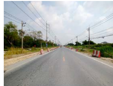
รูปเดือนกุมภาพันธ์ ๒๕๖๙