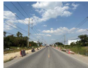
รูปเดือนมกราคม ๒๕๖๙