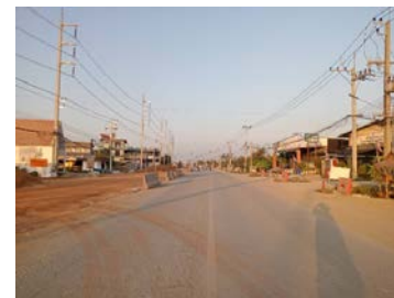
รูปเดือนมกราคม ๒๕๖๙