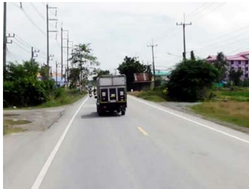
รูปก่อนการก่อสร้าง กม.ที่ ๕+๙๐๐