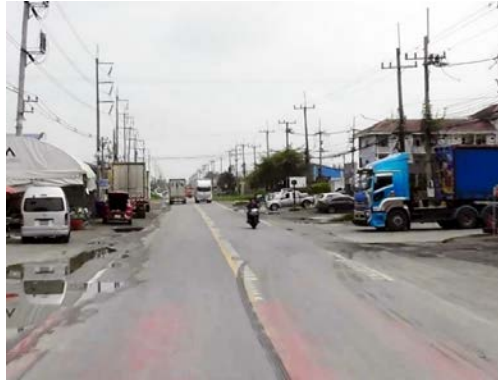
รูปก่อนการก่อสร้าง กม.ที่ ๓+๘๐๐