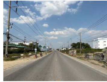
รูปเดือนมกราคม ๒๕๖๙