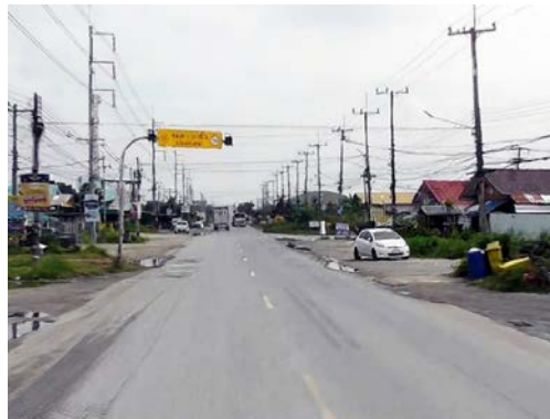
รูปก่อนการก่อสร้าง กม.ที่ ๔+๓๐๐