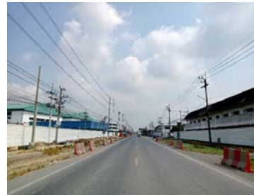
รูปเดือนกุมภาพันธ์ ๒๕๖๙