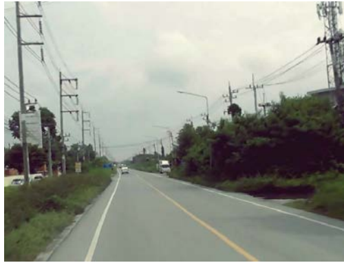
รูปก่อนการก่อสร้าง กม.ที่ ๐+๘๐๐