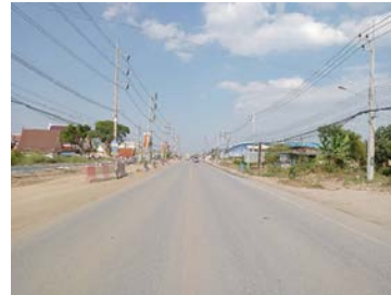
รูปเดือนกุมภาพันธ์ ๒๕๖๙