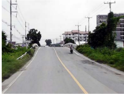
รูปก่อนการก่อสร้าง กม.ที่ ๓+๔๐๐