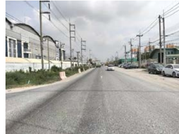
รูปเดือนกุมภาพันธ์ ๒๕๖๙