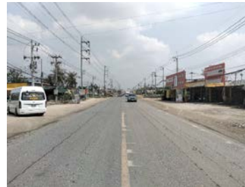
รูปเดือนกุมภาพันธ์ ๒๕๖๙