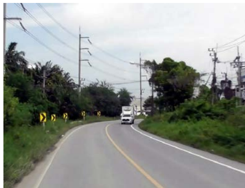
รูปก่อนการก่อสร้าง กม.ที่ ๐+๗๐๐