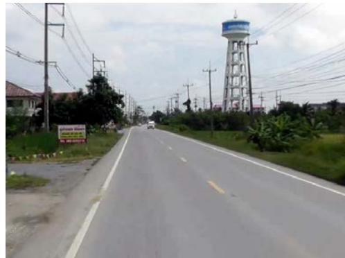
รูปก่อนการก่อสร้าง กม.ที่ ๕+๗๐๐