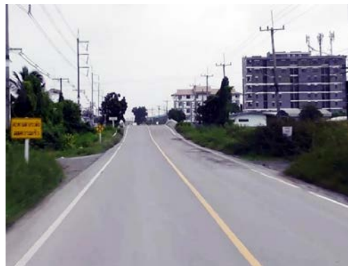
รูปก่อนการก่อสร้าง กม.ที่ ๓+๓๐๐