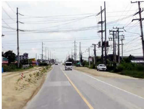
รูปก่อนการก่อสร้าง กม.ที่ ๖+๕๐๐