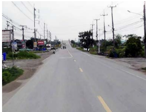
รูปก่อนการก่อสร้าง กม.ที่ ๔+๕๐๐