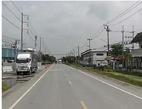
รูปก่อนการก่อสร้าง กม.ที่ ๑+๔๐๐