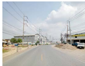
รูปเดือนกุมภาพันธ์ ๒๕๖๙