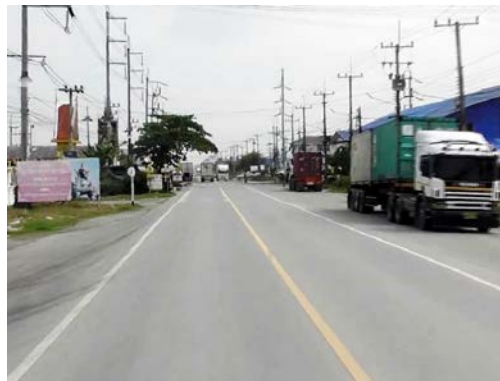
รูปก่อนการก่อสร้าง กม.ที่ ๓+๗๐๐