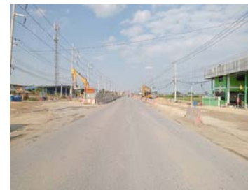
รูปเดือนมกราคม ๒๕๖๙