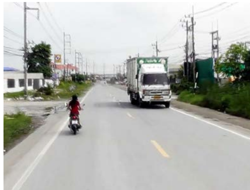
รูปก่อนการก่อสร้าง กม.ที่ ๒+๓๐๐