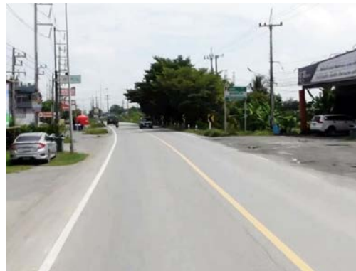
รูปก่อนการก่อสร้าง กม.ที่ ๖+๑๐๐