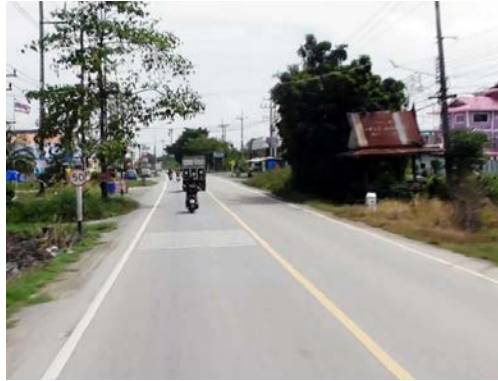
รูปก่อนการก่อสร้าง กม.ที่ ๖+๐๐๐