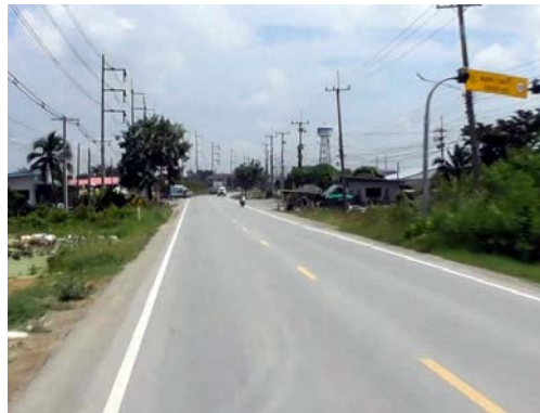
รูปก่อนการก่อสร้าง กม.ที่ ๕+๓๐๐