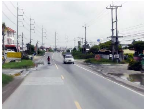
รูปก่อนการก่อสร้าง กม.ที่ ๒+๕๐๐