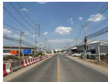
รูปเดือนมกราคม ๒๕๖๙