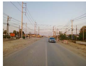
รูปเดือนมกราคม ๒๕๖๙