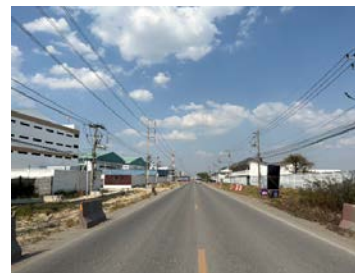
รูปเดือนมกราคม ๒๕๖๙