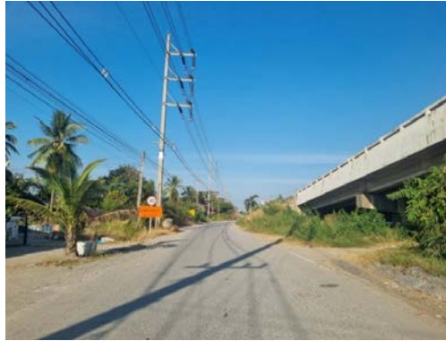
รูปก่อนการก่อสร้าง กม.ที่ ๕+๐๐๐