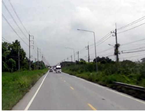
รูปก่อนการก่อสร้าง กม.ที่ ๑+๐๐๐