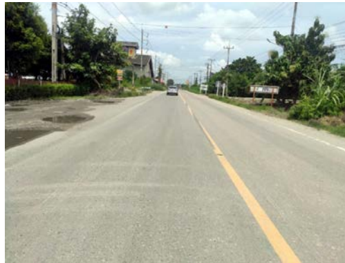
รูปก่อนการก่อสร้าง กม.ที่ ๕+๑๐๐