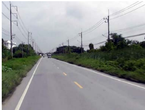
รูปก่อนการก่อสร้าง กม.ที่ ๑+๑๐๐