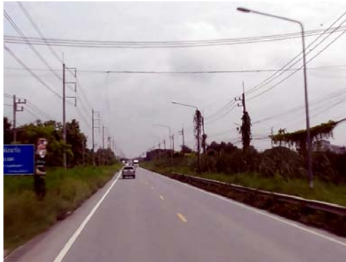
รูปก่อนการก่อสร้าง กม.ที่ ๐+๙๐๐