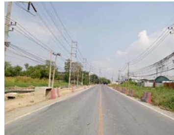
รูปเดือนกุมภาพันธ์ ๒๕๖๙