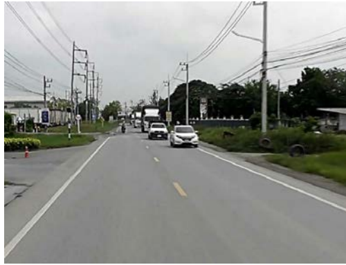
รูปก่อนการก่อสร้าง กม.ที่ ๑+๘๐๐