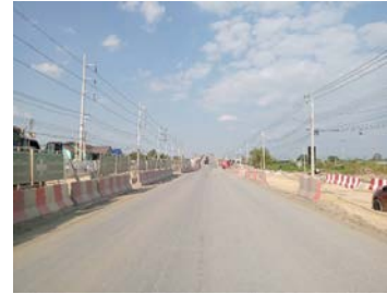
รูปเดือนมกราคม ๒๕๖๙