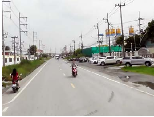
รูปก่อนการก่อสร้าง กม.ที่ ๒+๒๐๐