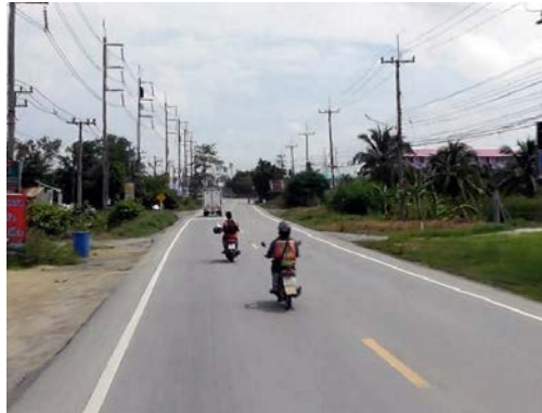
รูปก่อนการก่อสร้าง กม.ที่ ๕+๘๐๐