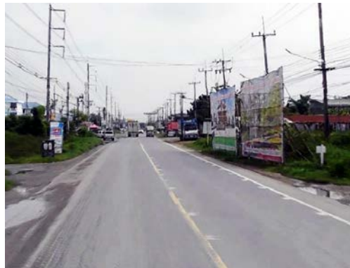
รูปก่อนการก่อสร้าง กม.ที่ ๔+๑๐๐