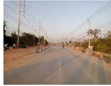
รูปเดือนมกราคม ๒๕๖๙