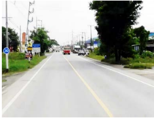
รูปก่อนการก่อสร้าง กม.ที่ ๓+๖๐๐