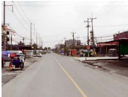
รูปก่อนการก่อสร้าง กม.ที่ ๓+๑๐๐