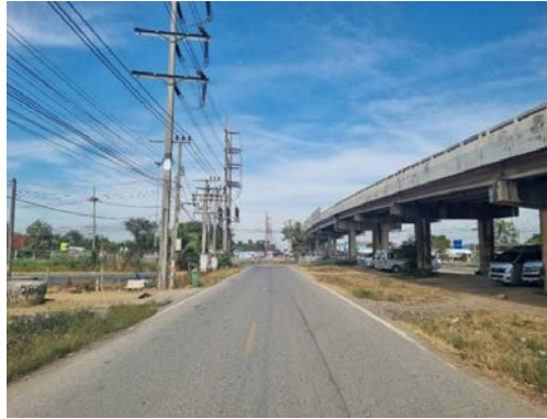
รูปก่อนการก่อสร้าง กม.ที่ ๔+๘๐๐