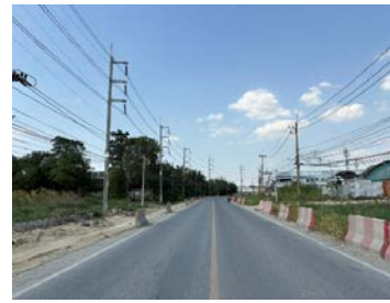
รูปเดือนมกราคม ๒๕๖๙