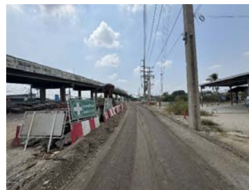
รูปเดือนกุมภาพันธ์ ๒๕๖๙