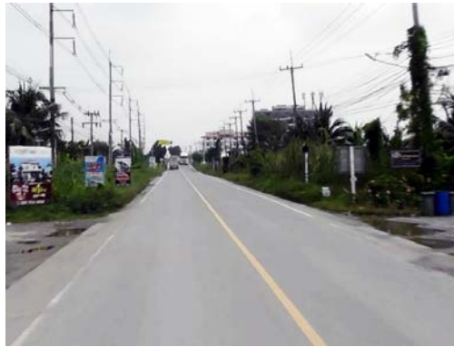
รูปก่อนการก่อสร้าง กม.ที่ ๓+๒๐๐