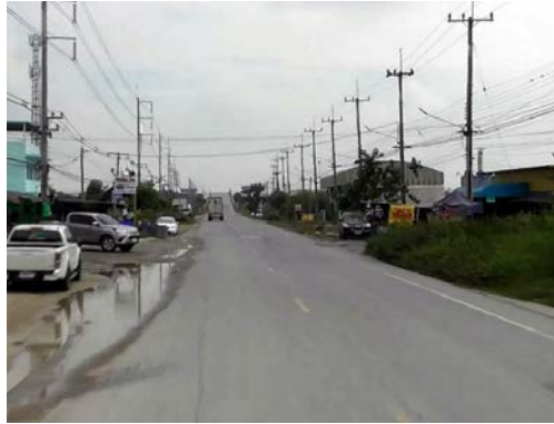
รูปก่อนการก่อสร้าง กม.ที่ ๔+๔๐๐