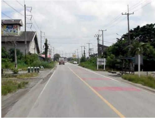
รูปก่อนการก่อสร้าง กม.ที่ ๕+๒๐๐