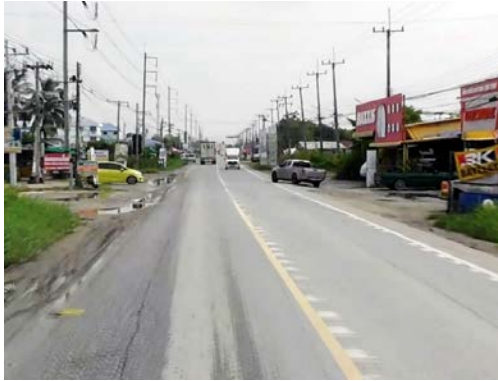
รูปก่อนการก่อสร้าง กม.ที่ ๔+๐๐๐