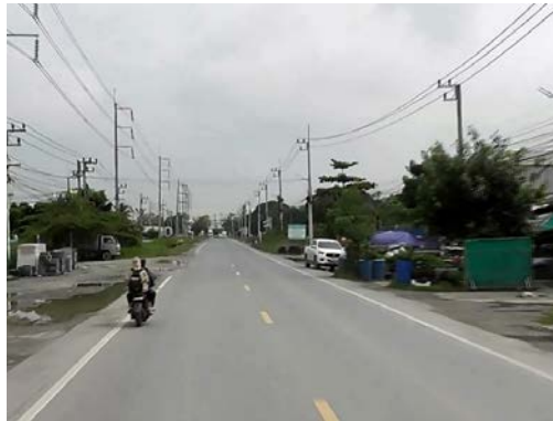
รูปก่อนการก่อสร้าง กม.ที่ ๑+๗๐๐