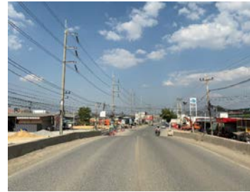
รูปเดือนมกราคม ๒๕๖๙