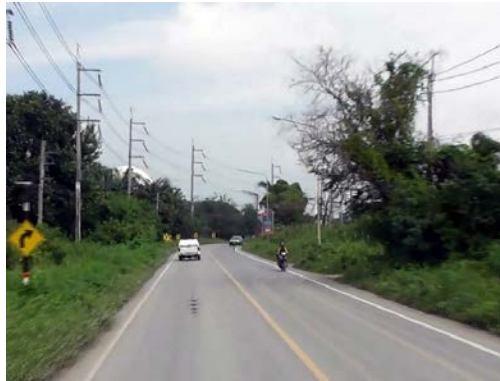
รูปก่อนการก่อสร้าง กม.ที่ ๐+๖๐๐