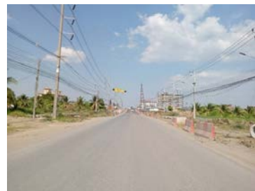
รูปเดือนกุมภาพันธ์ ๒๕๖๙