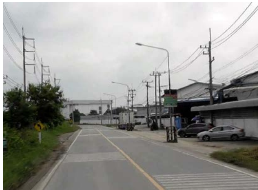
รูปก่อนการก่อสร้าง กม.ที่ ๐+๑๐๐