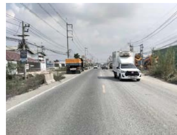
รูปเดือนกุมภาพันธ์ ๒๕๖๙