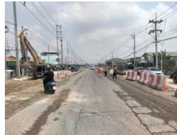
รูปเดือนกุมภาพันธ์ ๒๕๖๙