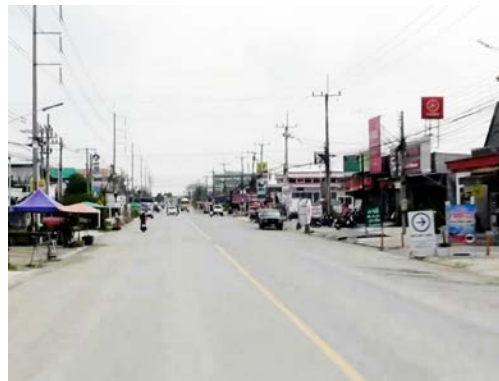
รูปก่อนการก่อสร้าง กม.ที่ ๒+๙๐๐