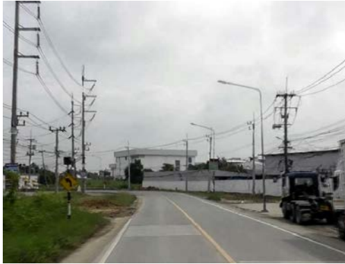
รูปก่อนการก่อสร้าง กม.ที่ ๐+๒๐๐