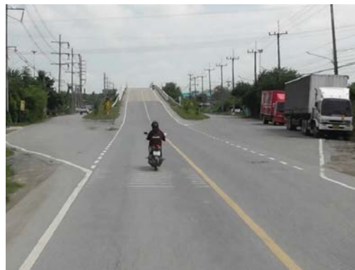
รูปก่อนการก่อสร้าง กม.ที่ ๔+๗๐๐