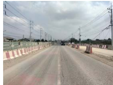
รูปเดือนกุมภาพันธ์ ๒๕๖๙