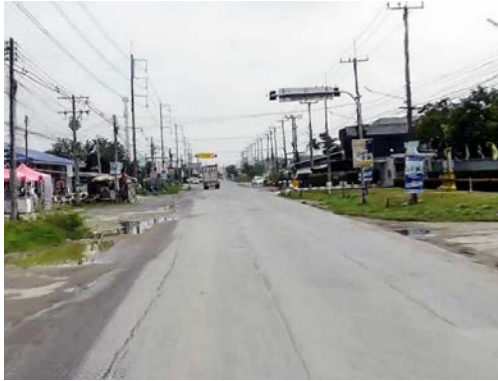
รูปก่อนการก่อสร้าง กม.ที่ ๔+๒๐๐