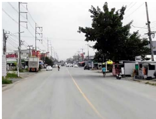
รูปก่อนการก่อสร้าง กม.ที่ ๒+๗๐๐