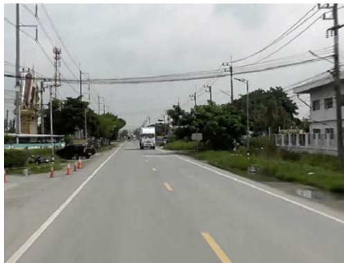
รูปก่อนการก่อสร้าง กม.ที่ ๑+๕๐๐