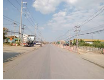
รูปเดือนมกราคม ๒๕๖๙