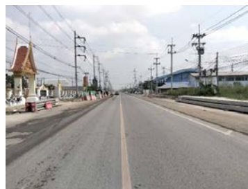
รูปเดือนกุมภาพันธ์ ๒๕๖๙