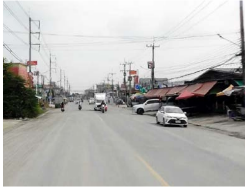
รูปก่อนการก่อสร้าง กม.ที่ ๒+๘๐๐