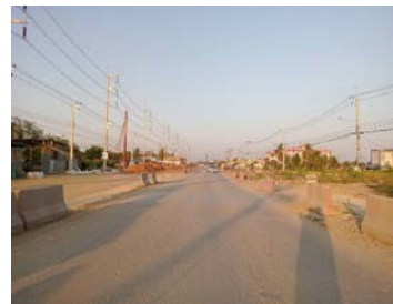
รูปเดือนมกราคม ๒๕๖๙