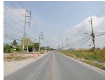
รูปเดือนกุมภาพันธ์ ๒๕๖๙