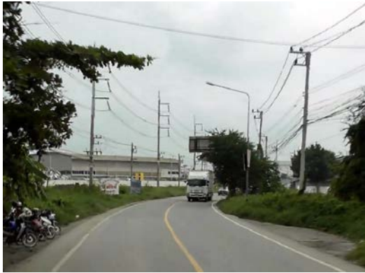
รูปก่อนการก่อสร้าง กม.ที่ ๐+๐๐๐ (จุดเริ่มต้นโครงการ)