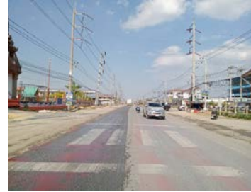
รูปเดือนมกราคม ๒๕๖๙