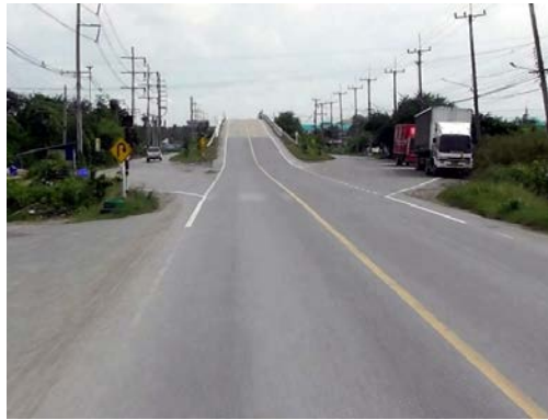
รูปก่อนการก่อสร้าง กม.ที่ ๔+๖๐๐