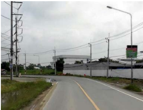
รูปก่อนการก่อสร้าง กม.ที่ ๐+๓๐๐