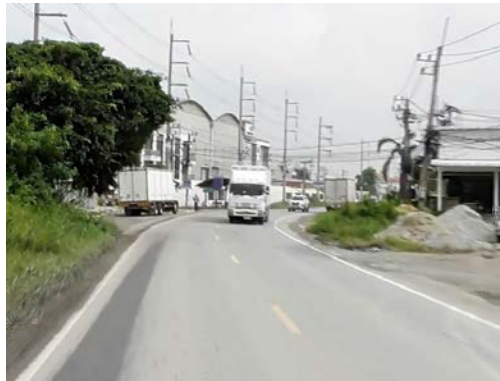
รูปก่อนการก่อสร้าง กม.ที่ ๒+๑๐๐