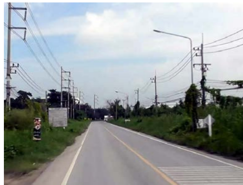
รูปก่อนการก่อสร้าง กม.ที่ ๐+๕๐๐