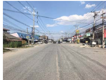
รูปเดือนกุมภาพันธ์ ๒๕๖๙