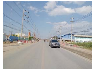
รูปเดือนมกราคม ๒๕๖๙