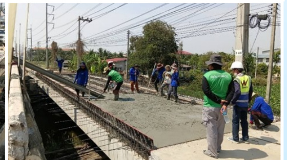
ตรวจสอบและควบคุมงานคอนกรีต Topping สำหรับ Box-Girder ยาว 20.00 เมตร (P2-P3) สะพานข้ามคลอง