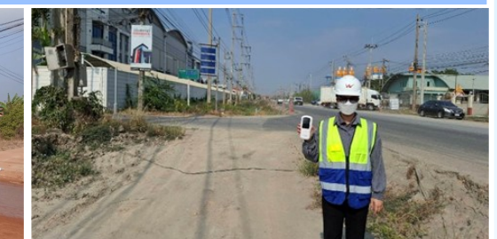
งานรดน้ำป้องกันฝุ่นเพื่อลดมลภาวะในการก่อสร้าง และตรวจสอบ PM. 2.5