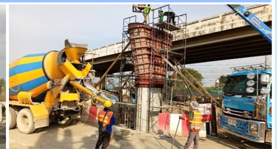
ตรวจสอบและควบคุมงานเหล็กเสริมเสา P6 STEP-2 สะพานข้าม ทล.7