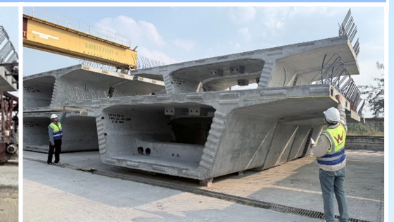
ตรวจสอบและควบคุมงานผลิตโครงสร้าง Segment ชนิด Standard Segment ช่วงความยาว 40.00 เมตร , 41.50 เมตร